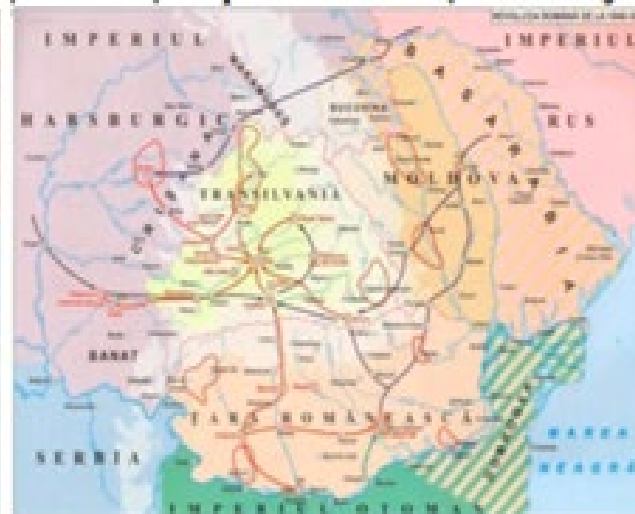
Harta 2: Revoluția română de la 1848 - 1849