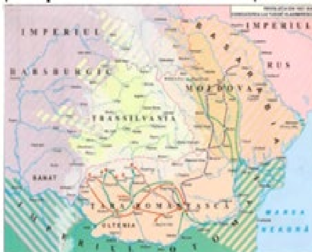
Harta 1: Revoluția lui Tudor Vladimirescu – 1821

Analizați comparativ următoarele două hărți istorice și formulați răspunsuri la cerințele de mai jos: